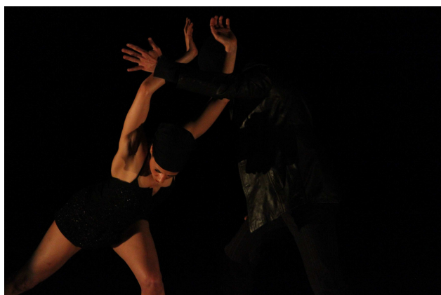
© Robin Berthault Espace Apollo Mazamet

. La Narratrice, figure bienfaitrice parfois, ou complice ambiguë. Ses chants soulignent les passages effrayants, ses paroles relèvent les situations absurdes ou comiques, sa présence désigne et dirige l'action.